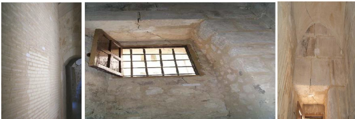
Figura 3: Grietas y fisuras en pasillo que conecta la Sacristía y la Capilla de la Comunión.

También, es destacable que en el pasillo que conecta la Sacristía y la Capilla de la Comunión se visualicen bastantes grietas y fisuras como podemos ver en la Figura 3, claramente debidas a los movimientos de descenso del terreno en ese punto.