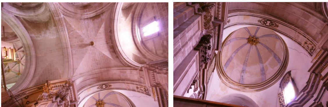
Figura 1: Vista cenital estado actual de la cúpula (izquierda) y del tramo abovedado (derecha).

Es destacable que en este caso el arquitecto realizó una clara apuesta por tener dos cuerpos diferenciados como podemos ver en la Figura 1. El primero de los cuerpos acomete de forma perpendicular a la nave y cubre el espacio con tres bóvedas (de cañón con lunetos en los extremos y de arista en la central); sin embargo, el segundo cuerpo se resuelve en disposición paralela a la Nave Central y con un volumen concebido de forma elíptica, quedando adosado al muro de la Epístola, es decir, orientándose hacia el Altar Mayor.