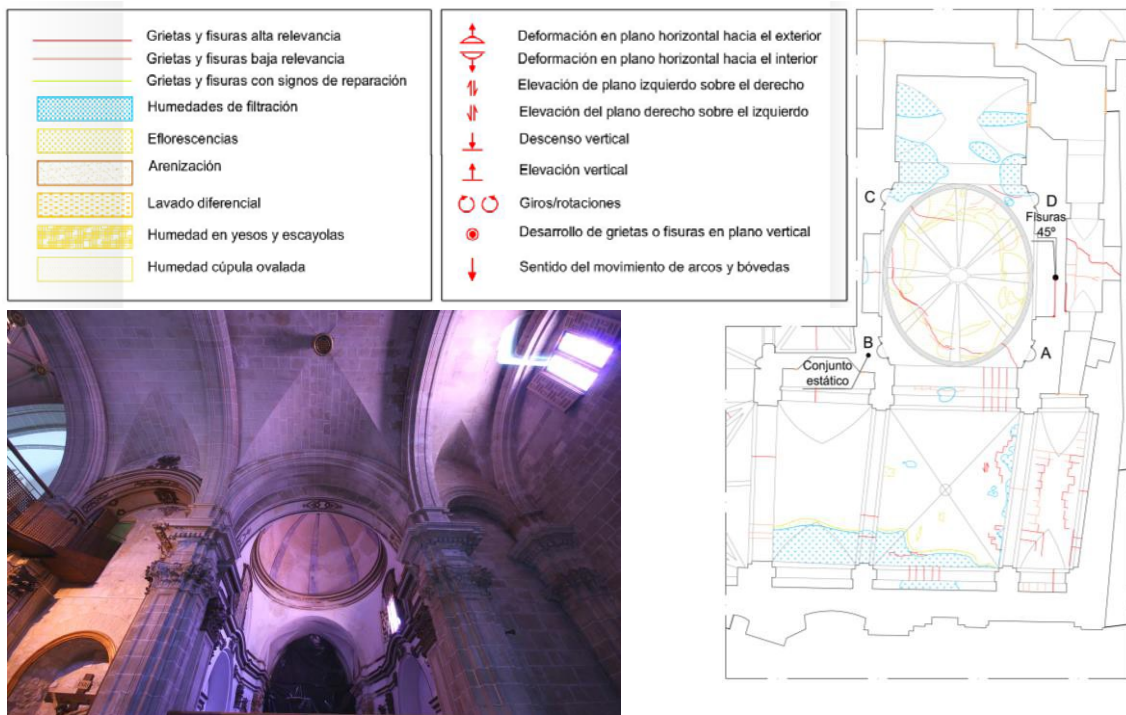
Figura 2: Planta cenital de la Capilla de la Comunión. Grafiado Estudio Diagnóstico.

Por tanto, el plano de planta cenital de la Capilla de la Comunión, permite describir, examinar y aclarar el fenómeno de las lesiones y sus esfuerzos en su globalidad, sin llegar, a pesar de todo, a una cuantificación del daño desde el punto de vista numérico.