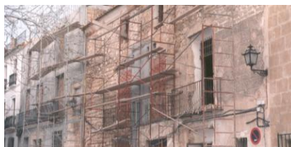
Figura 3: Estado de los edificios antes de la intervención.

Es más, por una parte, con un marcado carácter arqueológico, intentando recuperar los restos físicos de las distintas épocas (Figura 3), lo cual no era fácil (arcos cerrados por tabiques con pinturas dieciochescas, fachadas superpuestas con huecos tapados y otros nuevos abiertos, etc...) y por otra, arquitectónico, ya que debía servir para uso universitario con todas sus condiciones funcionales ajustadas a la normativa (instalación eléctrica, aire acondicionado, sistemas contra incendios, ascensores...). Es entonces cuando comenzaron a fijarse los criterios para la adaptación a unos usos muy distintos de aquellos que dieron forma a las Casas Palacio de Andresses y de Pere Bigot.