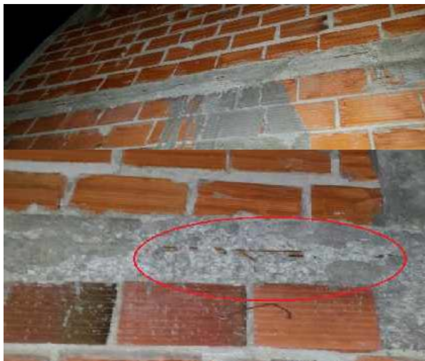
Figura 3: Viga 35x14 com suas armaduras expostas e corroídas por cloretos ocasionados por má execução da viga