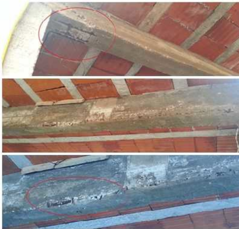
Figura 4: Outras vigas 35x14 com suas armaduras expostas e corroídas. Sem cobrimento adequado ocasionado por mal execução das fôrmas