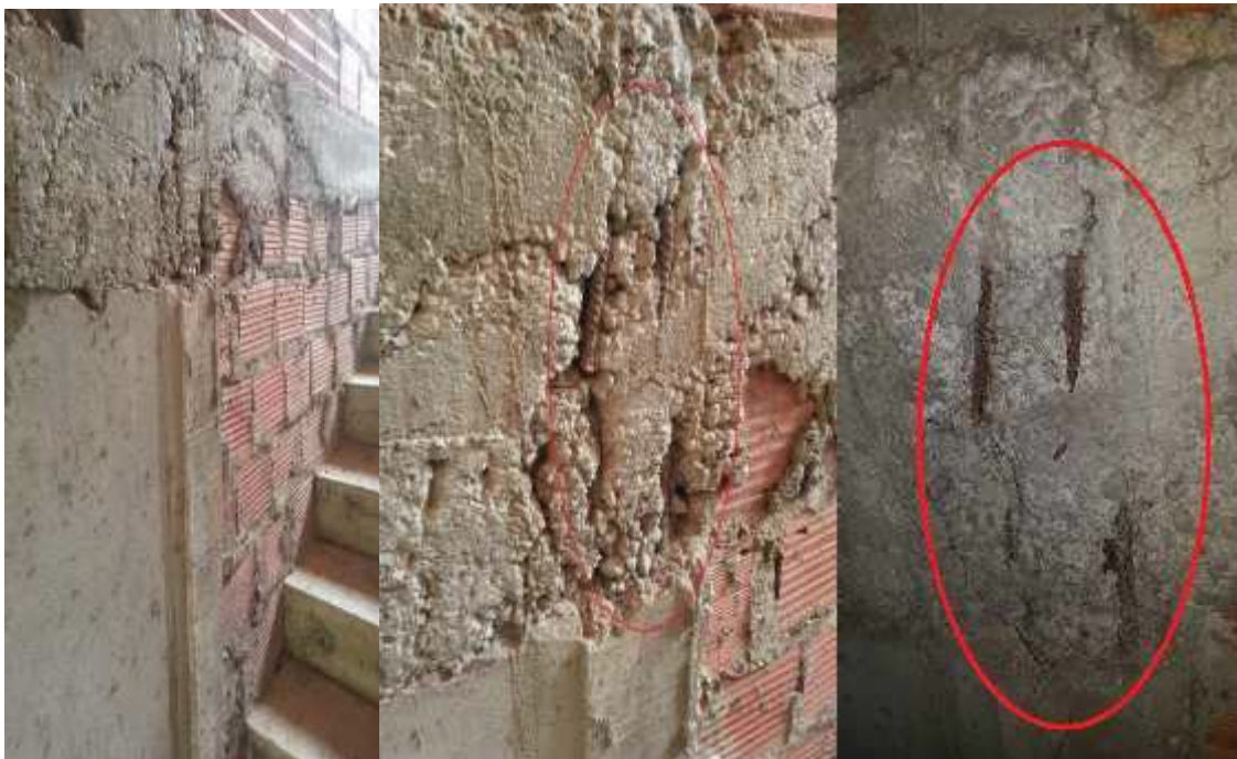
Figura 2: Pilar com segregação do concreto ocasionado por má execução, possivelmente por não ter respeitado as recomendações de lançamento do concreto e sem cobrimento adequado