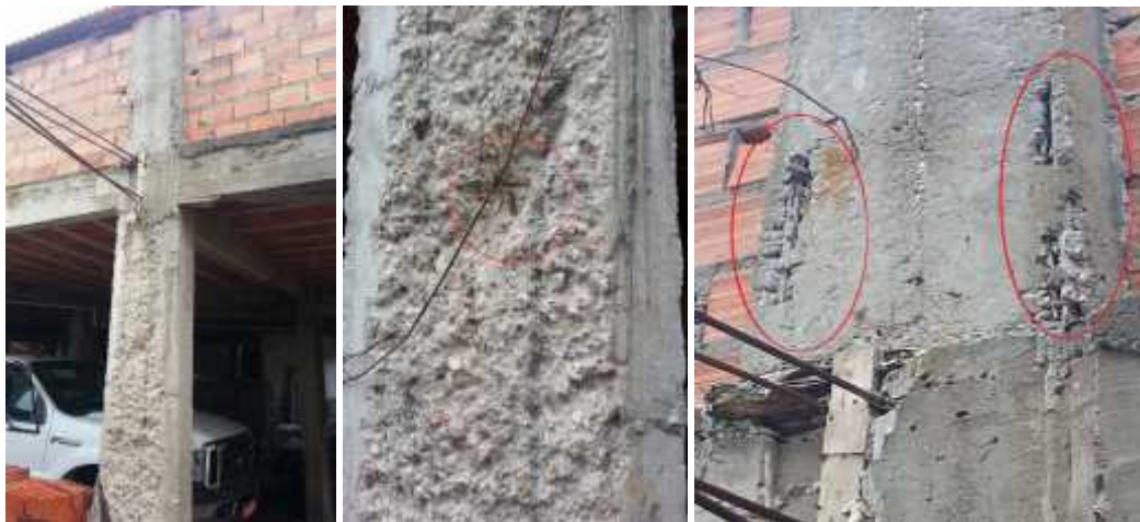
Figura 1: a) Visão geral do pilar 40x15 com armaduras expostas sem cobrimento adequado, segregação e fôrmas mal colocadas que cederam

Apesar do local em que as estruturas estão inseridas não sofrerem com a ação da maresia (atmosfera salina) e ser urbano, há a hipótese das corrosões verificadas serem motivadas por extração eletroquímica de cloretos, pois, pelas informações adquiridas que podem ter causado as patologias, corresponde aos fatores que são próprios desse tipo de corrosão, como foi explanado em tópicos anteriores. Por exemplo, o macrolima de Teresina que é altamente caloroso fazendo com que as estruturas sofram com uma incidência solar intensa, as manchas de cor marrom alaranjada, entre outros.