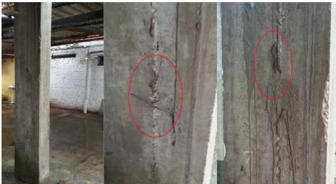
Figura 5: a) Pilar 40x15; b) e c) Arames evidenciados pela má execução das fôrmas podendo ocasionar problemas futuros com corrosão por cloretos